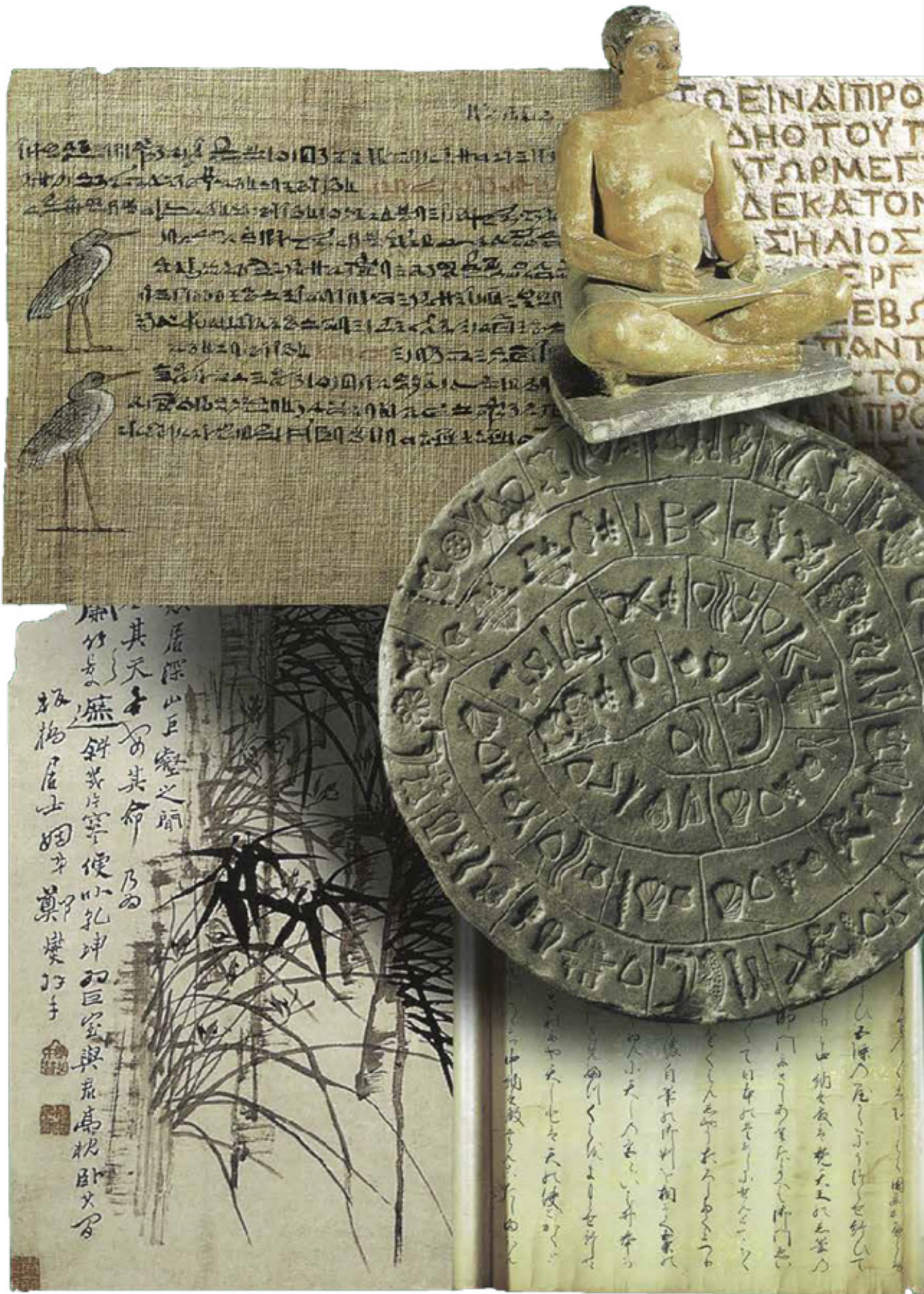
Belge 1: Kültepe çivi yazılarında çeyiz @ P: Sanat, Kültür Antika, "Yazı ve Sanat", s.21, Bahar 2001.

Binlerce yıl önce çivi yazılı belgelerde karşımıza çıkan bazı uygulamalar, bugün hâlâ sürdürülen çeyiz geleneğinin köklü geçmişini ortaya koyuyor. Asur ve Babil'de kızı verilen çeyizin şahitler huzurunda kayıt altına alınması, Anadolu'da günümüzde de "evlilik senedi" adıyla yaşamaya devam ediyor. Belgenin çevirisi şöyledir: "[...] giysi 10 (?) başlık, 1 tane kıl (dan yapılma) kilim, 40 litre keten yağı, 10 litre tatlandırılmış keten yağı(?), 1 tane 3 yaşında inek, 10 tane koyun (?), 1 tane bazalt hâmişum, değirmen taşı, , 1 tane ... bira ekmeği için değirmen taşı ve (?) buhrum; 1 tane öğütme taşı ile birlikte (değirmen) taşı, 1 tane tere için değirmen taşı, 1 tane berber sandığı, 1 tane nushum sandığı, 1 tane kamış [...], 1 tane palmiyeden (yapılma) sandık, 2 tane üst ahşap yatak, 1 tane ahşap masa, 1 tane iplik sandığı, 1 tane ahşap kadabibu-doluma tezgahı ve dokuma için gerekli tüm araçlar. (Bu İpqu-İstar'ın oğlu Marduk muballit'in kızı, Marduk'un naditum'u Tâb-Esagila'ya babası Marduk-muballit'in verdiği çeyizdir."