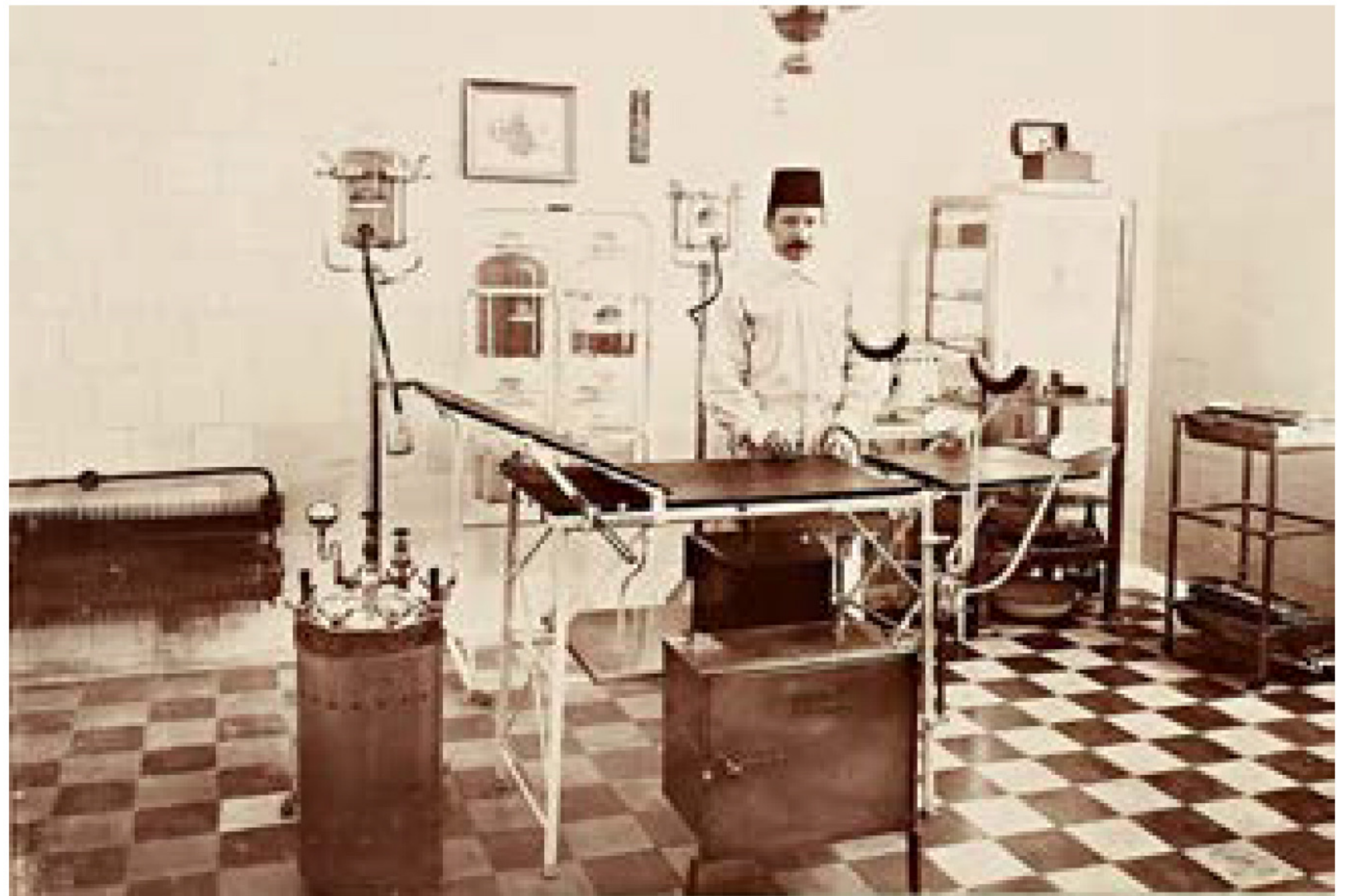
Sultan II. Abdülhamid'in Yıldız Albümlerinde yer alan aşağıdaki fotoğrafta Hamidiye Etfal Hastanesi ameliyathanesi ve cerrahî görölüyor.

Rum Tabibhânesi olarak da adlandırılan okulla ilgili bir vesikada, işinde uzman ve yetkin doktorlar yetişmesinin "has-