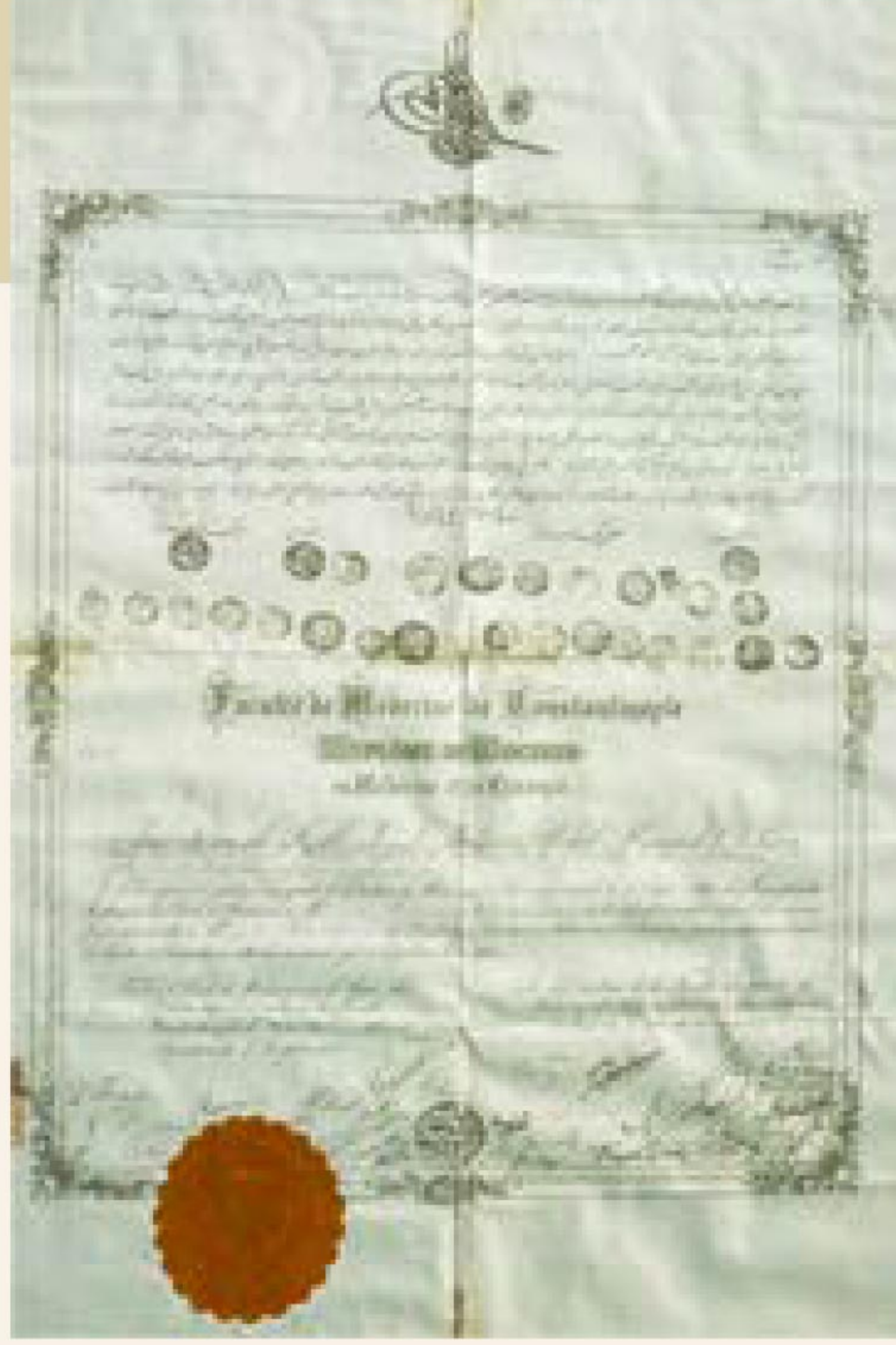
Hilmi Ziya Ülken'in babası Mehmet Ziyaüddin Efendi'nin 1893 tarihli Tıp İcâzetnâmesi.

Osmanlıların tarih sahnesine çıkmasıyla birlikte, Fatih Sultan Mehmed Han'ın ilmî çalışmalara bizzat katılması, Ali Kuşçu gibi meşhur hocaları İstanbul'a davet etmesi ve üst düzey medreseler kurması sayesinde İstanbul, yalnızca Osmanlı topraklarının değil, dünyanın dört bir yanından talebelerin geldiği bir ilim merkezine dönüşmüştür. Ancak Batı dünyasında yaşanan siyasî, sosyal, kültürel ve ekonomik gelişmelerin etkisiyle ilim merkezleri zamanla yön değiştirmiştir. Aslan Terzioğlu'nun ifadesiyle, bir zamanlar Selçuklu ve Osmanlı'nın -kadim dönemin mirasçısı olarak- Orta Asya ve Hindistan'dan Viyana,